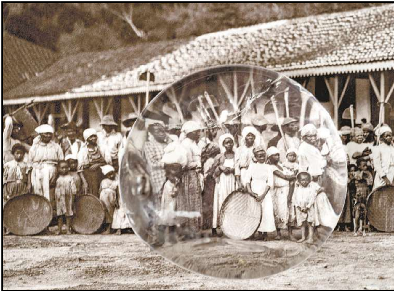
Obra de Isabel Löfgren e Patrícia Gouvêa com intervenção em foto de Marc Ferrez que integra a exposição Mãe Preta

casas nos jornais. “Querida identificar o homem amazônico a partir de uma estética própria. Interessava-me saber como ele é mostrado e em qual espaço. Percebi que apareciam no noticiário policial. Eram homens mestiços, jovens, sem camisa, que eram obrigados a posar para as fotos. Meu trabalho é uma forma crítica de olhar para essas imagens que não têm tanta ética”, diz.